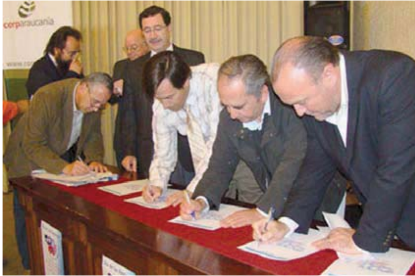
◀ Lanzamiento Día de las Regiones en La Araucanía

En otras actividades, se asistió al “Segundo Taller Regional Visión 2020. La infraestructura para el Desarrollo Regional”, a la charla “Instrumentos para la protección del empleo y la capacitación”, organizada por el seremi de economía y al taller del Servicio de Impuestos Internos de la Novena Región sobre la fiscalización del transporte de madera, con la finalidad de regularizar la actividad y disminuir las cifras de robos de este material. Asimismo, se asistió a la celebración del Día de las Regiones, en que participan diferentes organizaciones encabezadas por CorpAraucanía, como un primer paso para trabajar activamente por una efectiva descentralización del país.