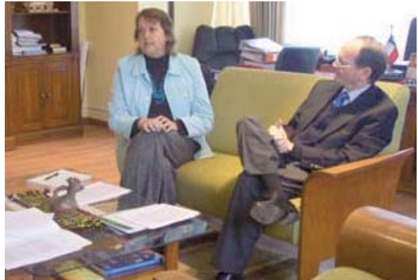
▲ Reunión con autoridades en la Novena Región para el análisis del convenio

a largo plazo. Señaló, además, que este acuerdo se convertirá en una oportunidad para que una vez que el mercado se estabilice, muchos trabajadores cuenten con más herramientas.