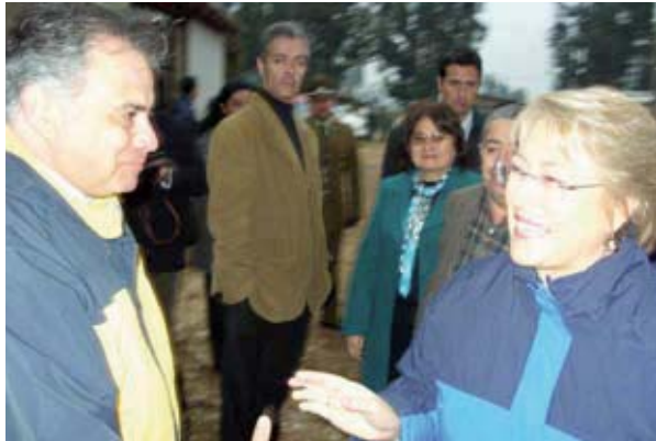
▲ La Presidenta Michelle Bachelet durante el lanzamiento del Convenio de Desarrollo de Capital Humano en la Séptima Región