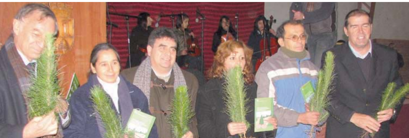
▲ El Presidente de CORMA Bío Bío hace entrega de plantas a la comunidad en el Programa de Forestación Campesina.

Por su parte, CORMA Araucanía en conjunto con la Corporación Nacional Forestal, dio inicio a la campaña de incendios forestales en la Novena Región. Entre las actividades programadas destacaron el concurso regional de dibujo escolar que impulsa CONAF y que cuenta con el patrocinio de empresas de la zona.