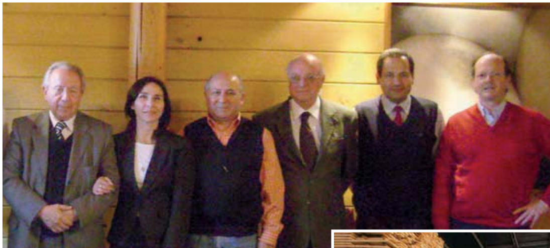
▲ Directiva de CORMA Nacional se reúne con gremios de la Novena Región