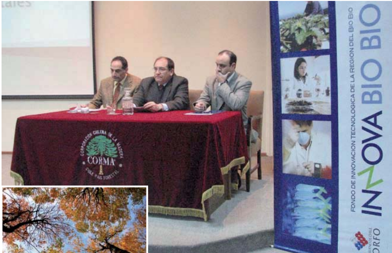
CORMA Bío-Bío se adjudicó proyecto de diagnóstico tecnológico ▲ de PYMES a través del fondo Innova Bío-Bío