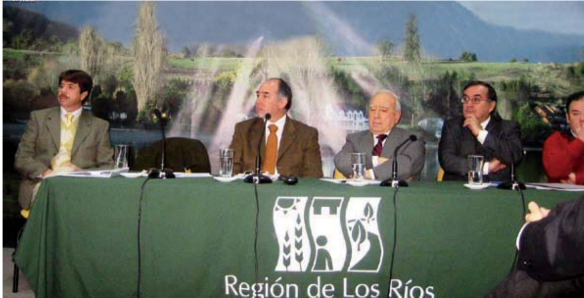
CORMA Los Ríos-Los Lagos participa en diversas entidades públicas y privadas que promueven el desarrollo regional ▲

Tras conocer las medidas propuestas por el gobierno en relación a ampliar los beneficios de la forestación, CORMA sostuvo diversos encuentros con el ministerio de agricultura y CONAF para analizar los efectos reales que éstas generarían durante los próximos dos años.