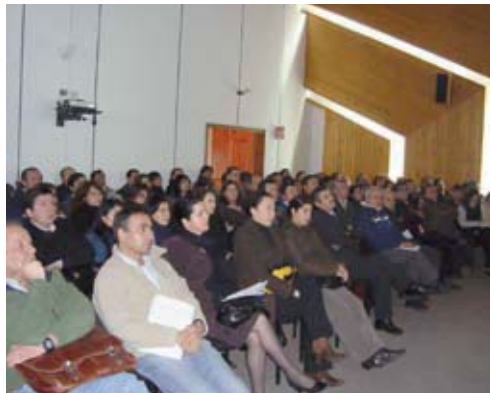
▲ Taller de normas laborales realizado por CORMA Bío-Bío.