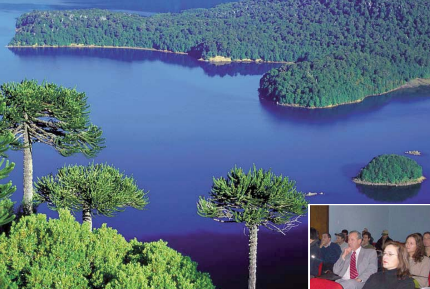
Taller sobre modificaciones del DL 701 en Región de La Araucanía ►