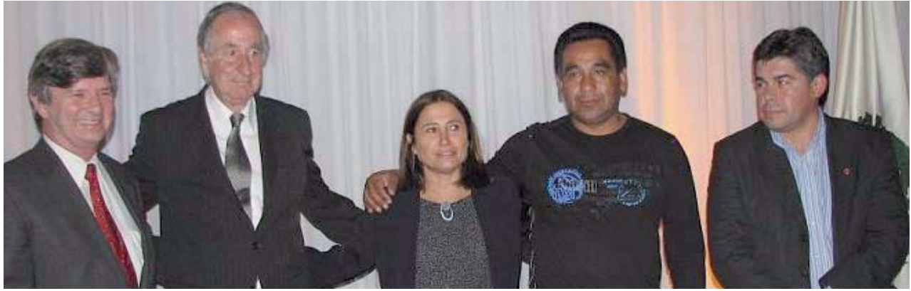
▲ Firma del convenio en Concepción con la participación de CORMA, autoridades y trabajadores