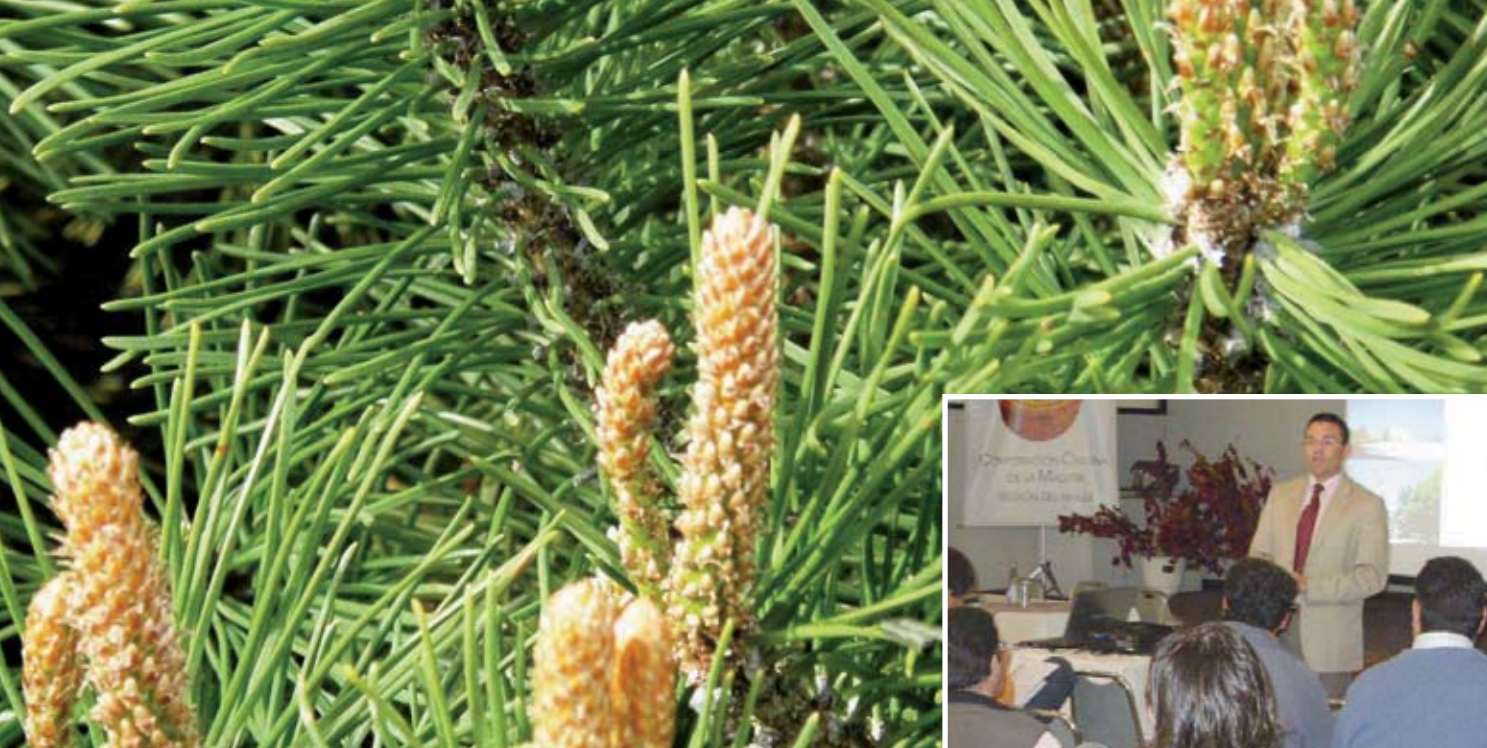
Taller APL en la Región del Maule ►

La sede Los Ríos-Los Lagos desarrolló, con CONAF y ONEMI, el “Convenio marco de coordinación y apoyo recíproco para la protección forestal contra incendios forestales macro zona”, en el cual se hizo un llamado a la comunidad para prevenir los siniestros. Además, se dio a conocer el trabajo de coordinación público privado que actualmente desarrolla el Comité Regional de Prevención de Incendios Forestales en la Región de Los Lagos.